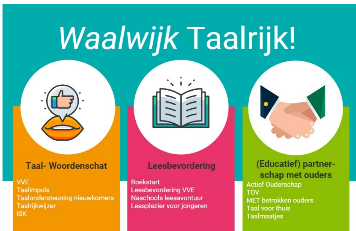
Figuur 1. De drie pijlers Waalwijk Taalrijk! en bijbehorende activiteiten 2016-2017